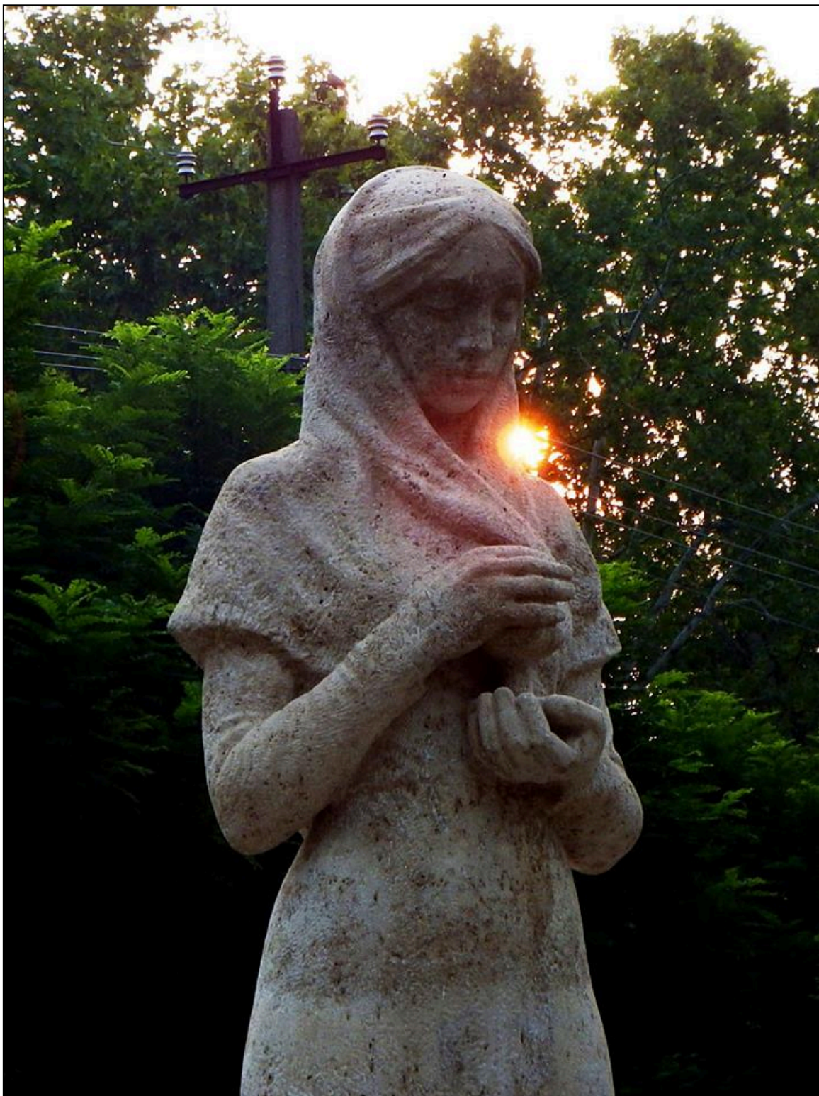
3. kép. II. világháborús emlékmű III.