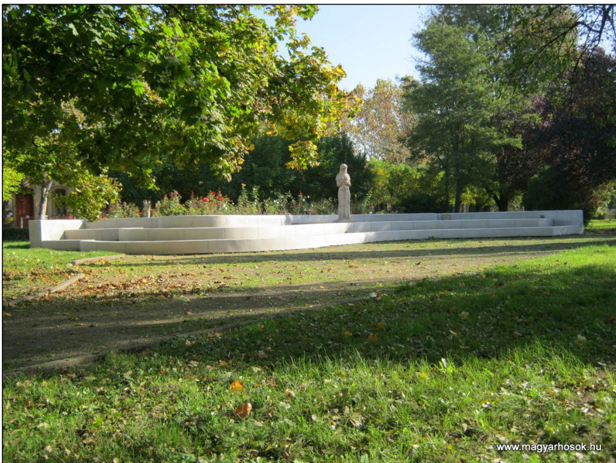
1. kép. II. világháborús emlékmű I.